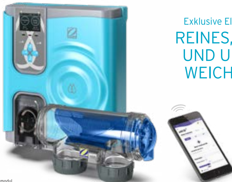
Modell mit optionalem pH-Regelungsmodul

Exklusive Elektrolyselösung mit Magnesium REINES, KRISTALLKLARES UND UNVERGLEICHLICH WEICHES POOLWASSER